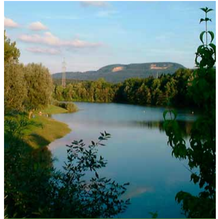
Stausee Schömburg

Der Nauf-Nab-Trauf-Bus und der Rad-Wander-Bus 300 fahren mehrmals täglich vom Bahnhof Hechingen zum Burgparkplatz.