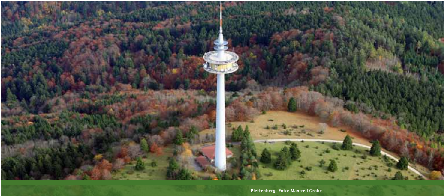
Plettenberg, Foto: Manfred Grohe