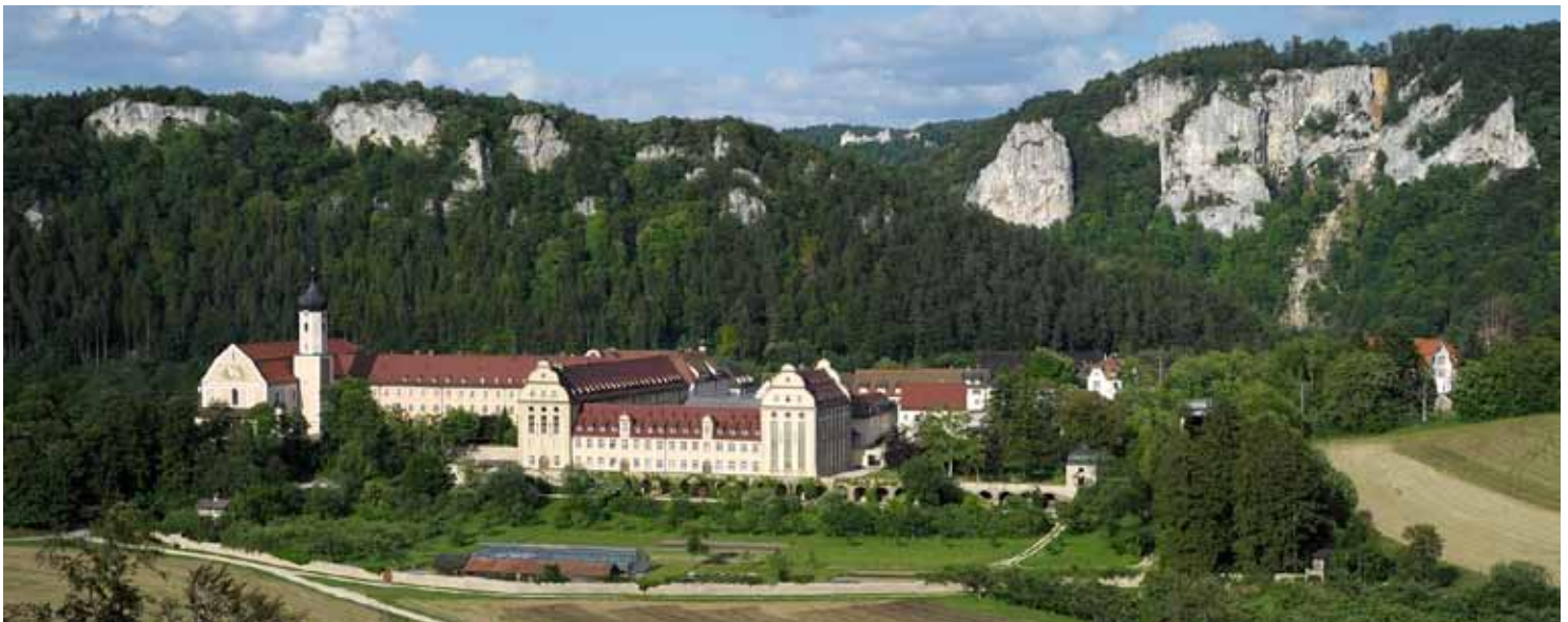
Kloster Beuron