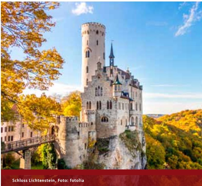
Schloss Lichtenstein