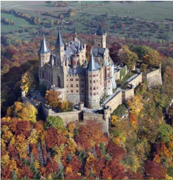
Burg Hohenzollern, Foto: Manfred Grohe