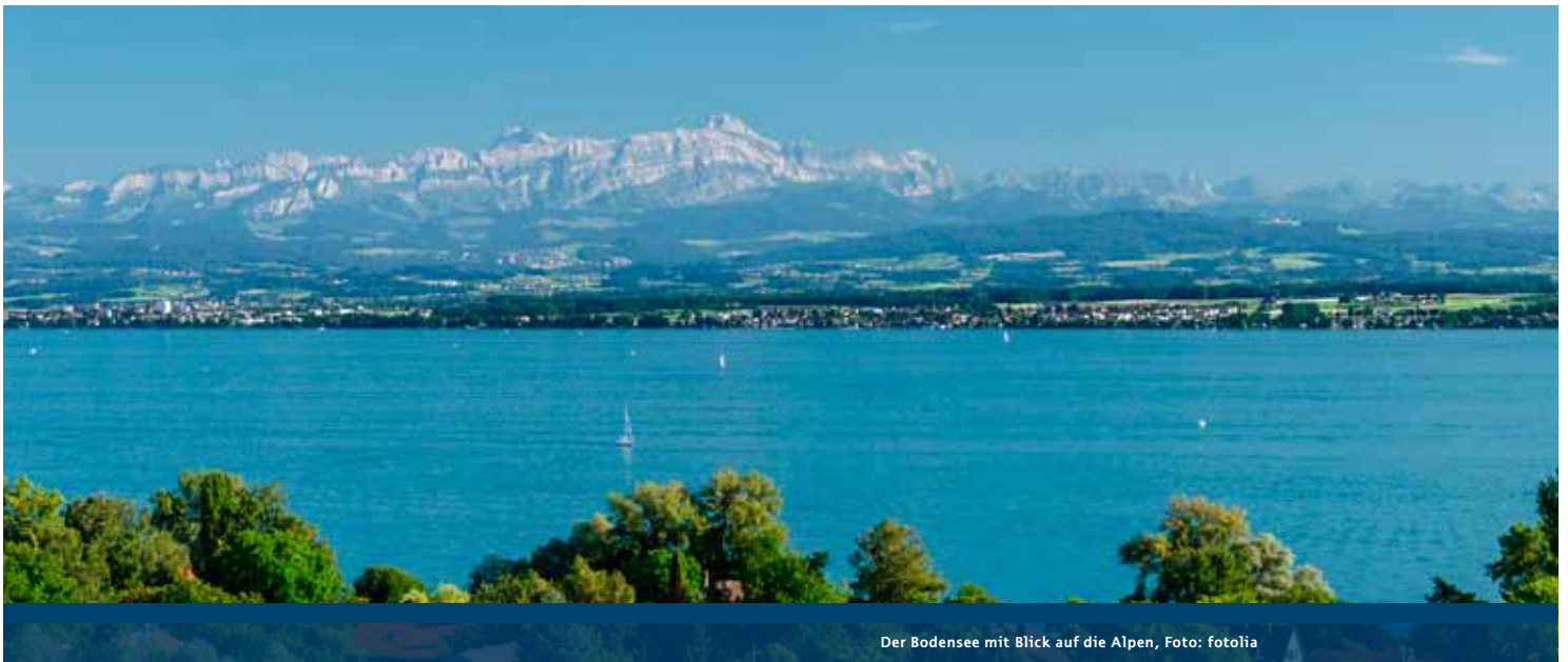
Der Bodensee mit Blick auf die Alpen