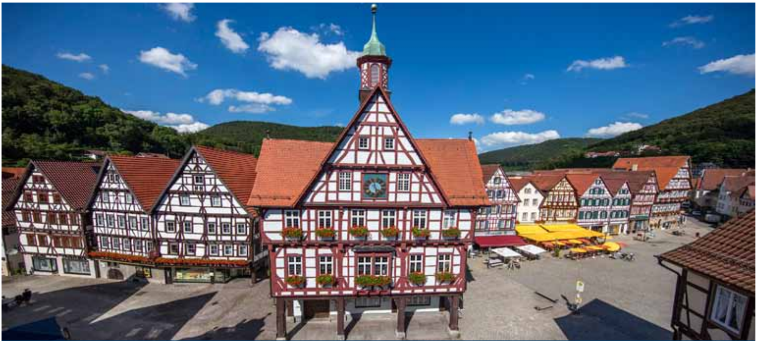
Marktplatz Bad Urach, Foto: Tourismus Bad Urach